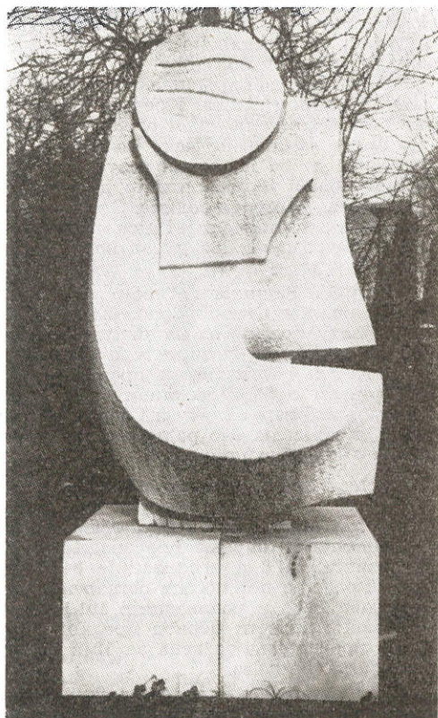
Карло Раму, Милано: Идол

ТРАДИЦИОНАЛНА КУЛТУРНО-УМЕТНИЧКА МАНИФЕСТАЦИЈА СВЕЧАНО ОТВОРЕНА НА ДАН БОРЦА. НОВИ КВАЛИТЕТ АРАНЂЕЛОВАЧКОГ КУЛТУРНОГ ЛЕТА